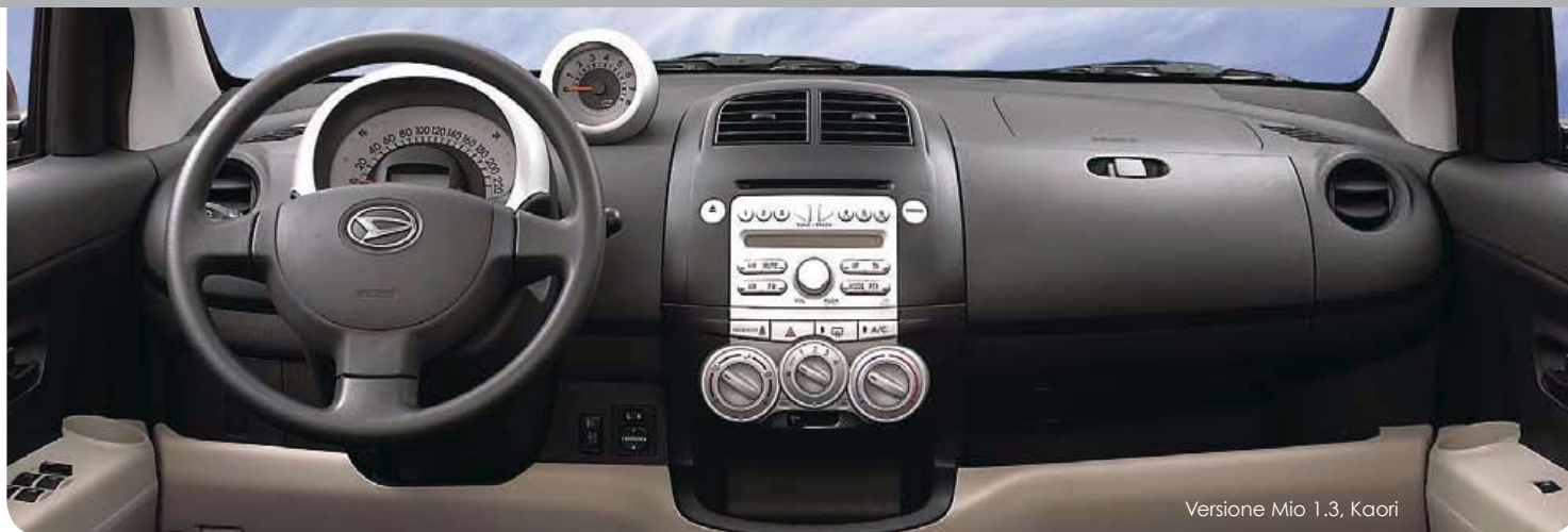
Versione Mio 1.3, Kaori