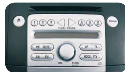
Radio RDS con lettore CD