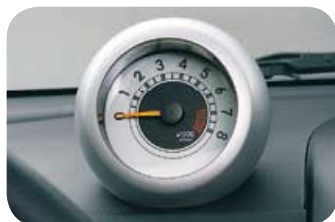
Contagiri separato (Mio 1.3, Kaori)