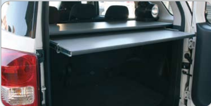
Piano scrivania Basic