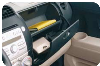
Cassetto a doppio scomparto