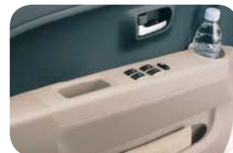
Porta bottiglie e tasca portaoggetti