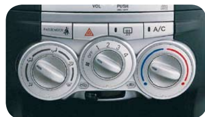
Climatizzatore (Mio, Kaori)