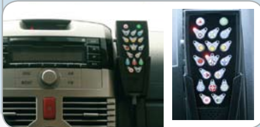
Key Pro Sound - Centralina Controllo Luci e Suoni