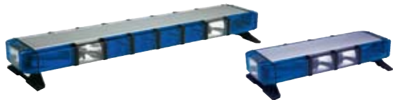
Edge™ 9M CTS ECO Strobe