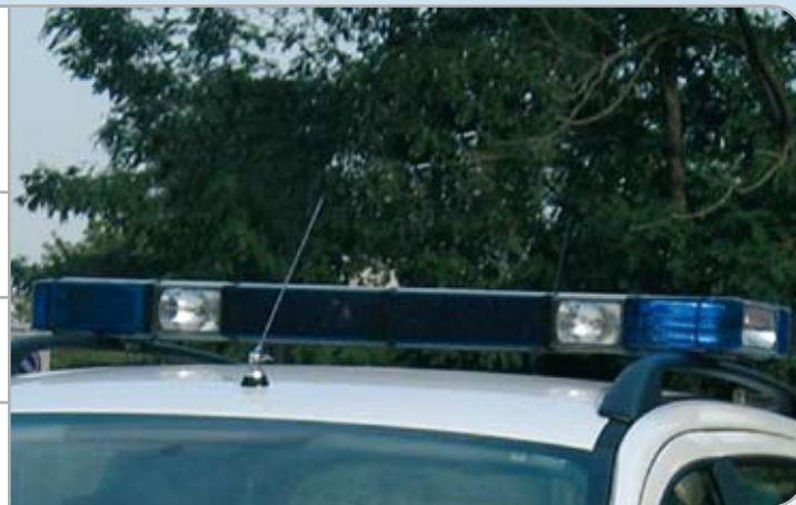
Edge™ Ultra Freedom™ FL SuperLED