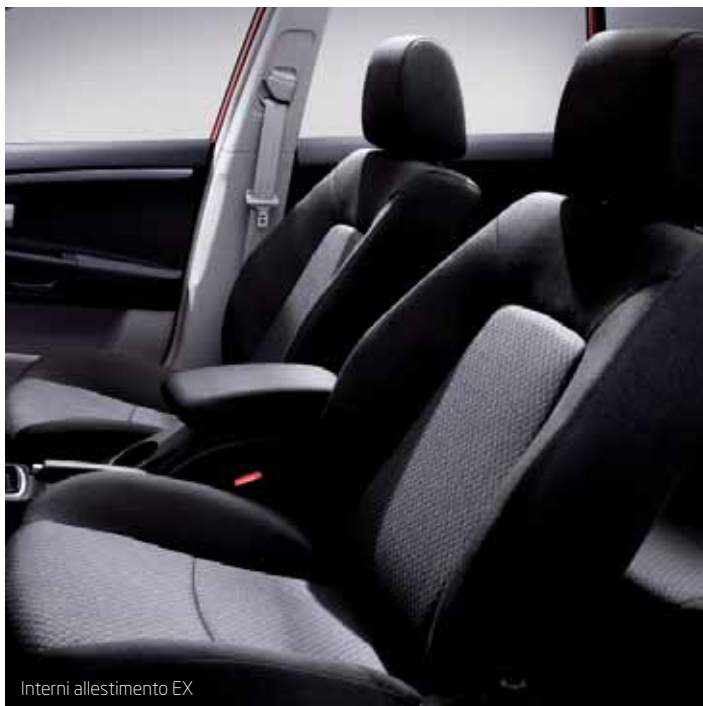
Interni allestimento EX