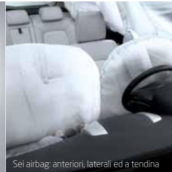
Sei airbag: anteriori, laterali ed a tendina