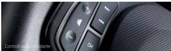
Controlli audio al volante