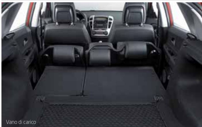
Vano di carico

Il passo più lungo rispetto alla media dei concorrenti garantisce una spaziosità interna che consente ai passeggeri della zona posteriore di viaggiare comodi.