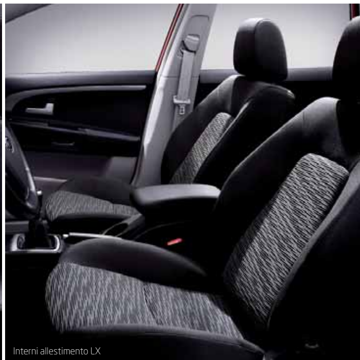
Interni allestimento LX