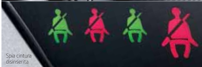
Spia cintura disinserita