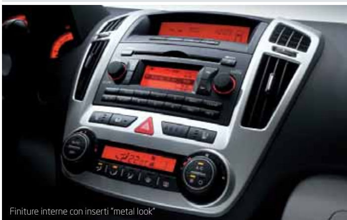
Finiture interne con inserti "metal look"

La posizione dei comandi è tale che voi non dovete staccare gli occhi dalla strada. L'impianto audio comprende radio con lettore CD e comandi al volante, semplici da usare. La strumentazione a tre quadranti conferisce alla vettura un'immagine di grande sportività. Il caldo colore arancio, studiato per i gusti europei, è il colore predominante anche nel display del climatizzatore e del computer di bordo. I materiali e le plastiche interne dimostrano la costante ricerca di qualità di Kia, tali da fare apparire cee'd simile ad auto di classe superiore.