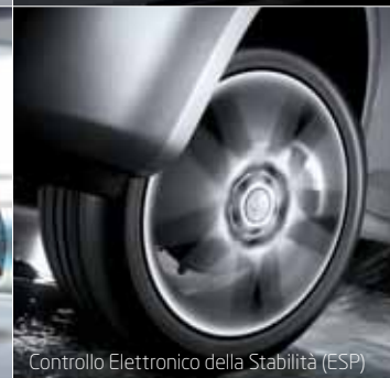
Controllo Elettronico della Stabilità (ESP)