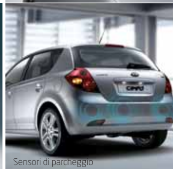
Sensori di parcheggio