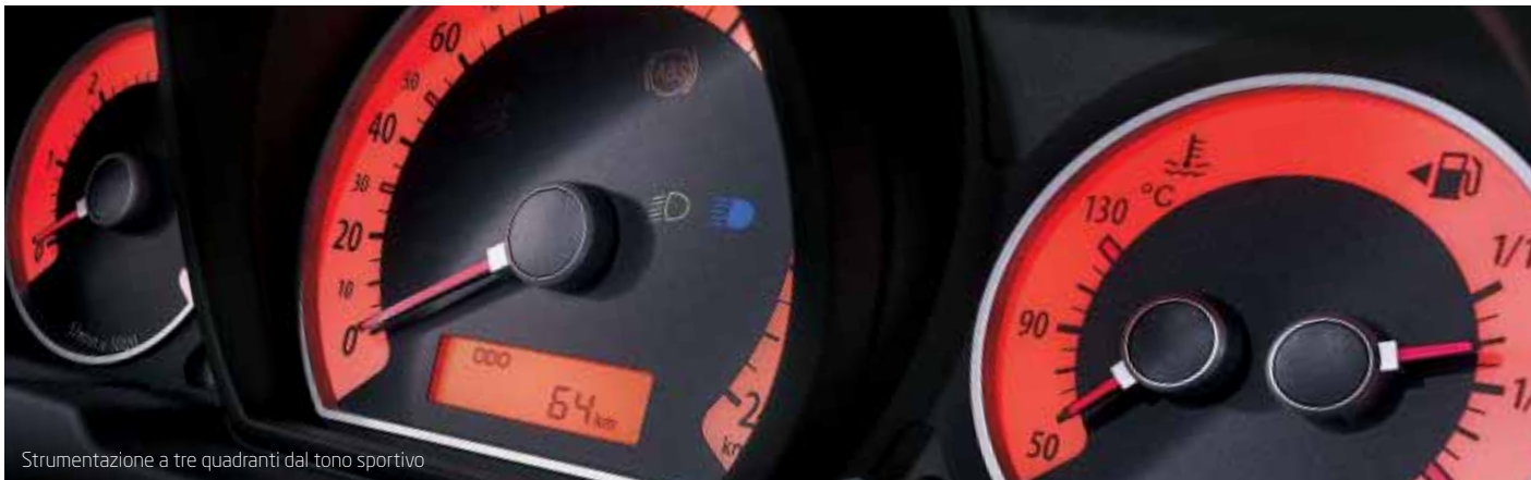
Strumentazione a tre quadranti dal tono sportivo